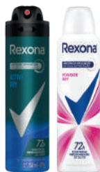
Desodorante Aerossol Rexona 150ml