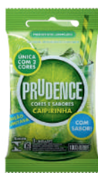
Preservativo Prudence c/ 3un