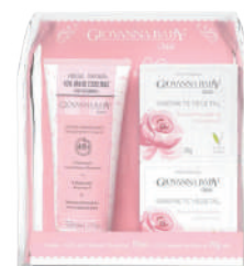
Kit Giovanna Baby Eterno Encanto Loção Hidra. + 2 Sabonetes em barra