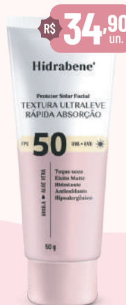
Hidrabene Prot. Sol. Facial FPS 50 - 50g