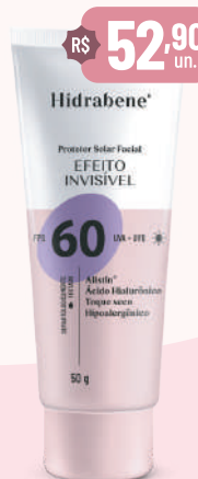
Hidrabene Prot. Sol. Facial FPS 60 Invisível - 50g