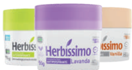
Desodorante Creme Herbissimo 55g