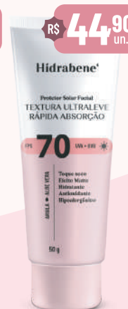
Hidrabene Prot. Sol. Facial FPS 70 - 50g