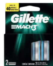
Carga para Aparelho de Barbear Gillette Mach 3