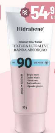
Hidrabene Prot. Sol. Facial FPS 90 - 50g