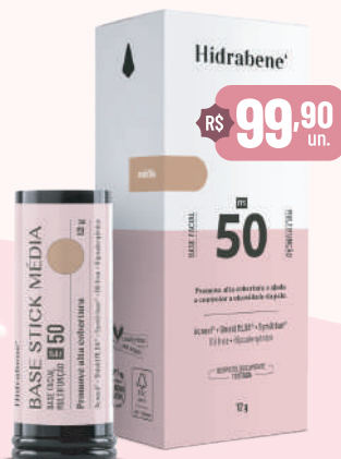
Hidrabene Base Stick Clara / Média / Escura - 12g