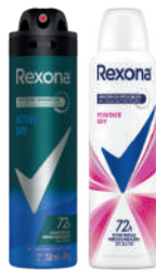
Desodorante Aerossol Rexona 150ml