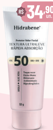
Hidrabene Prot. Sol. Facial FPS 50 - 50g