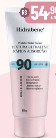
Hidrabene Prot. Sol. Facial FPS 90 - 50g