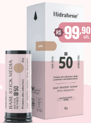
Hidrabene Base Stick Clara / Média / Escura - 12g