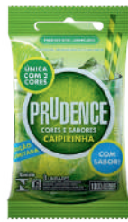
Preservativo Prudence c/ 3un