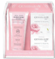
Kit Giovanna Baby Eterno Encanto Loção Hidra. + 2 Sabonetes em barra