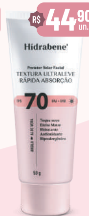
Hidrabene Prot. Sol. Facial FPS 70 - 50g