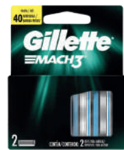
Carga para Aparelho de Barbear Gillette Mach 3