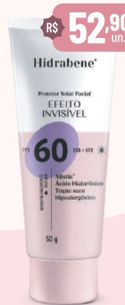
Hidrabene Prot. Sol. Facial FPS 60 Invisível - 50g