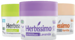
Desodorante Creme Herbíssimo 55g